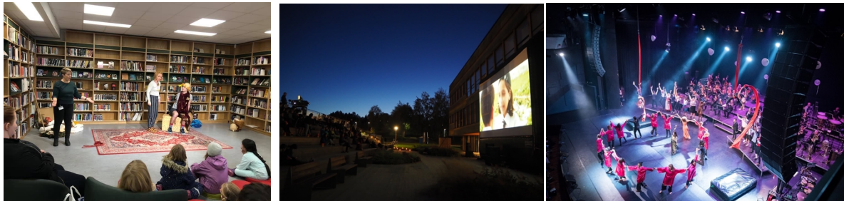
Saupstad-Kolstad har gjennom programperioden styrket eksisterende, og etablert nye, arenaer for kultur som trekker folk både fra bydelen og fra hele byen. Bilder over: Saupstad bibliotek (venstre), utekino i parken ved Heimdal videregående skole (midten) og fargespill-forestilling i Bifrost-salen på Heimdal videregående skole (høyre).

De strukturelle fysiske endringene iv , i samspill med sosiale innsatser, antas å bidra til god og framtidsrettet byutvikling og å forbedre levekårene i bydelen Saupstad-Kolstad over tid. Utbedret infrastruktur antas på sikt også å bedre boligmarkedets strukturelle betingelser, og dermed også interesse for private investeringer i bydelen. Disse resultatene av satsingen vil vi først kunne måle lenger frem i tid.