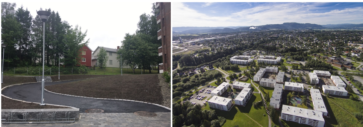
Bydelens kulturminner er løftet frem i perioden. Byantikvaren har deltatt i flere møter i bydelen for å fortelle om de antikvariske verdiene i "Kvitbyen" - de hvite blokkene som ble bygget ut helhetlig på 1960 og -70-tallet. Søbstad gård (antikvarisk klasse B og C) er også igjen synlig fra Saupstad sentrum etter at Boligstiftelsen

I 2014 gjennomførte Rambøll en kvantitativ kartlegging av bydelen - en nullpunktsmåling. Denne vil følges opp med en sluttevaluering høsten 2020, for å kartlegge effekter av satsingen.