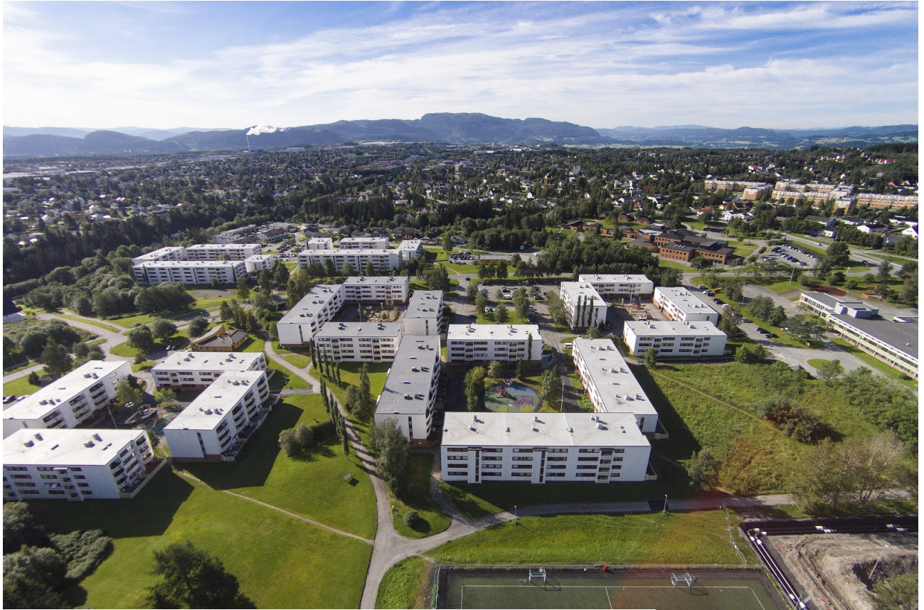
Dronefoto fra 2015, typiske Saupstad-tun med gamle Saupstad skole til høyre i bildet.