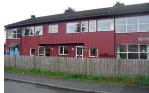
Skytterveien barnehage 1 – 5 åringen