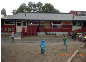
Utmyra barnehage 3- 5 åringen