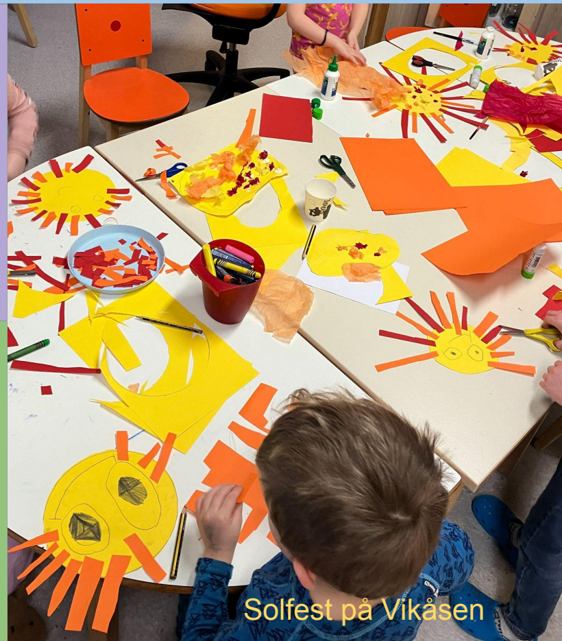
Solfest på Vikåsen

Foreldresamtaler Forberede eksterne og interne overganger Foreldremøte Tradisjoner: Markering av samefolkets dag Solfest (Vikåsen) Påskeaktiviteter