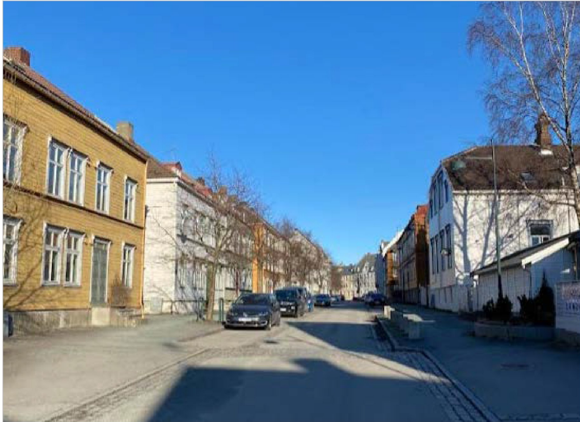
Østersunds gate, sett østover fra krysset Fjæregata