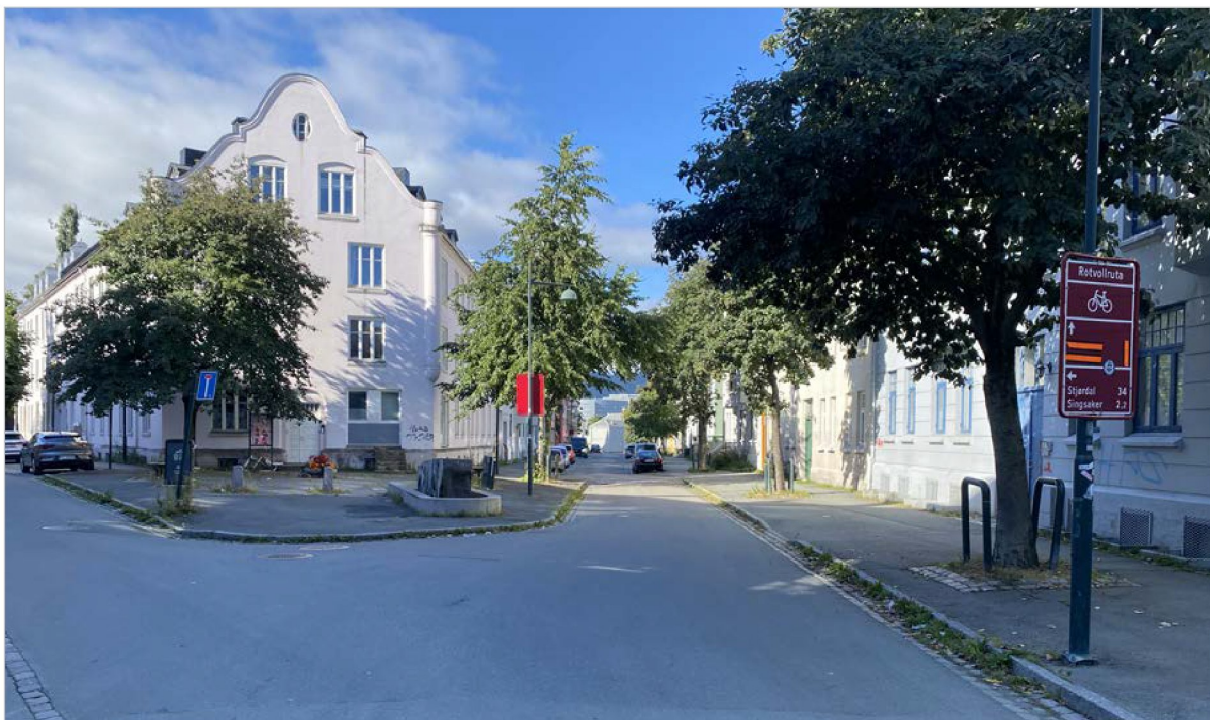
Østersunds gate, sett vestover fra Ulstadløkkveien.

Østersunds gate ligger vest i bydel Lademoen, og løper parallelt med Innherredsveien. Den strekker seg i overkant av 200 meter fra Fjæregata og østover til Ulstadløkkveien, og ender ut i et "strykejernkryss" med en liten åpen plass med kunstnerisk utsmykning. Gregus gate krysser Østersunds gate omtrent midtveis. Mot nord grenser gata mot jernbanen og Svartlamon. Mot vest ender gata i Strandveiparken, hvor det i dag er en liten park (Gullparken). Gata fremstår som en boliggate, i tillegg til at bydelshuset og Lademoen barnehage ligger i gata. Trondheim kommune er eier av flere bygårder langs gata, og boligene benyttes som kommunale utleieboliger. Deler av gata har parkeringslommer langs fortau. En rekke av trær langs gatas vestside gir en grøntstruktur i sommerhalvåret.