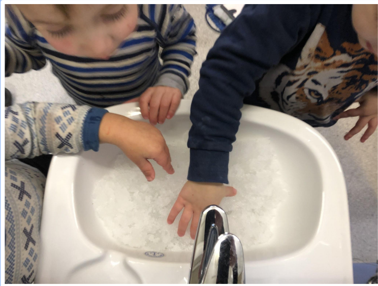
Snøen smelter når vi tar vann på den.

Spørsmålet vi stilte oss, var: “Hva slags lyd blir det hvis vi tramper på snøen inne?”