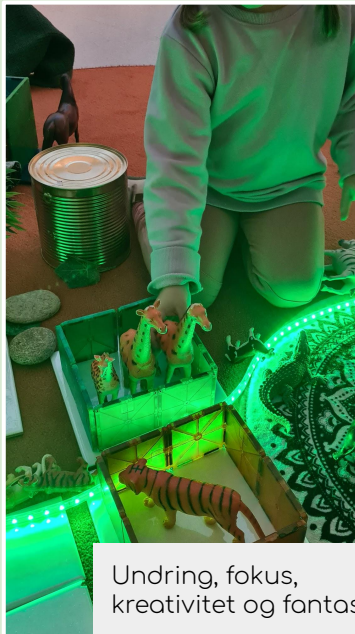
Undring, fokus, kreativitet og fantasi.

Hos oss skal alle barn ha mulighet til å delta aktivt i lek, utforske og være nysgjerrig sammen med andre. For å utvikle vår forståelse og kunnskap i forhold til hvordan vi kan tilrettelegge det fysiske leke- og læringsmiljøet i barnehagen, så deltar vi i nettverket "Barn & Rom". Målet er at vi sammen med andre barnehager skal utvikle kunnskap som bidrar til barns beste.