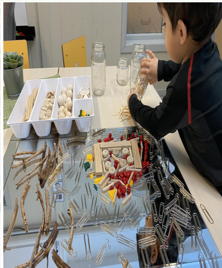
Konstruksjonslek. Lek med mønster og farger.